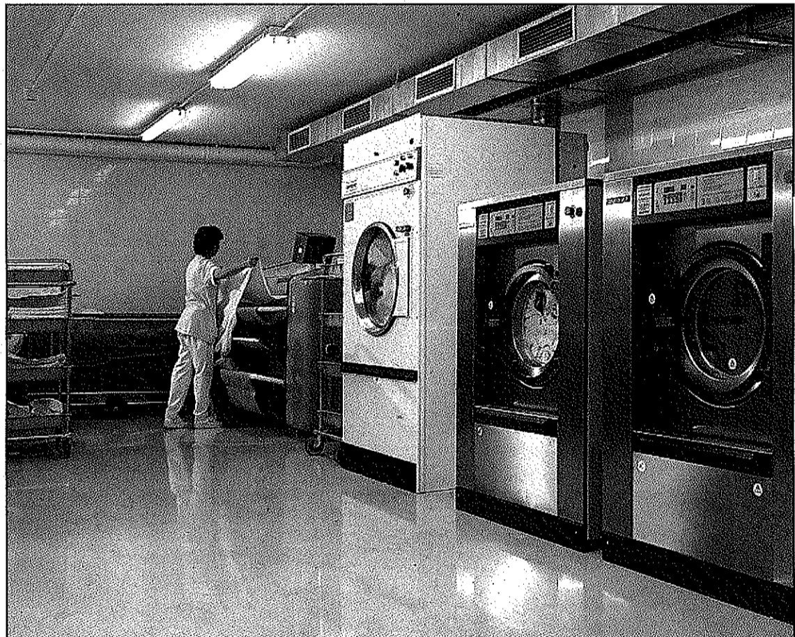
El contrato de unos servicios de limpieza debe ser cumplido rigurosamente por la empresa proveedora y el centro.

Los aspectos que el personal de mantenimiento de los centros de mayores deben vigilar muy de cerca son los relacionados con el gas, el agua y el desagüe. En general, como explican los espe-